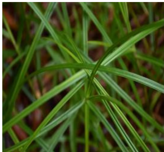
หญ้าสามคม