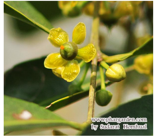
กำแพงเจ็ดชั้น