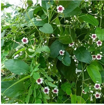
กระพังโหม