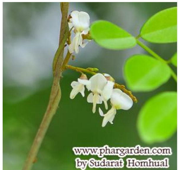
เถาว์ลย์เปรียง